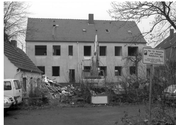
Synagoge in Osterholz-Scharmbeck (2004). Das Gebäude kurz vor dem Abriß/Synagoge in Osterholz-Scharmbeck (2004).

The former synagogue in Osterholz-Scharmbeck, erected in 1864/65, was destroyed on 9 th December 2004 – the first day of Chanukka 5765. The two researchers of the Fachgebiet Baugeschichte felt distraught when visiting the site some hours before the demolition. While the bulldozer was levelling the garden, they tried to document the original wall-painting – a task the Institute for the Preservation of Monuments failed to do. Although the building was preserved very well – our students documented it in 1996/97 – it was not considered a historical monument and therefore was not protected. Since its remodelling in 1968, the synagogue had been used as a dwelling and only a small plaque stated that the Jewish community prayed there in the past. Due to emigration at the beginning of the 20 th century, services could no longer be conducted and the synagogue was sold on 2 nd November 1938. Its neogothic pointed arched windows were removed and replaced by rectangular ones, so that no evidence remains of its former religious use.