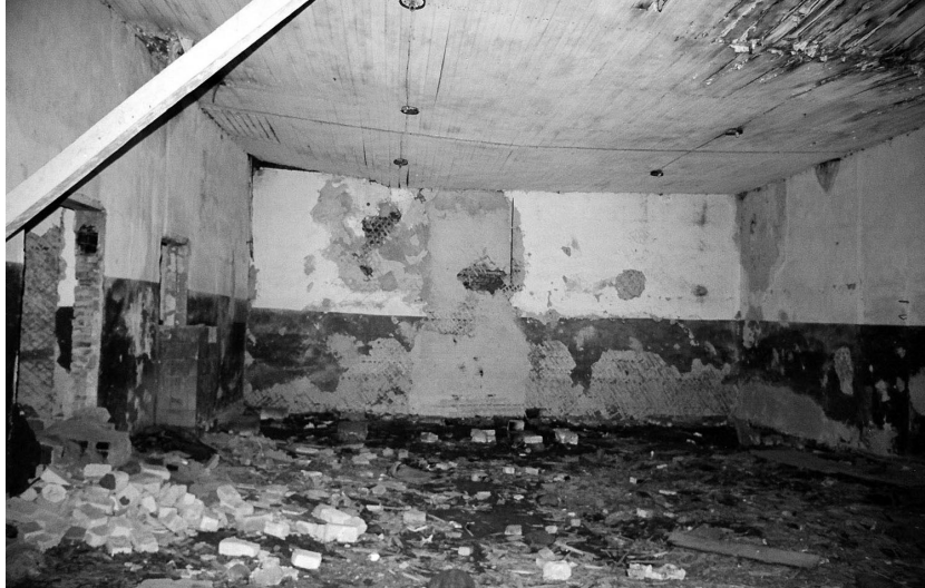
Synagogue in Pakruojis, interior toward east (2004)/Synagoge in Pakruojis, Inneres nach Osten (2004).

Alle Bauten sind in Blockbauweise errichtet und außen mit horizontaler oder vertikaler Holzverschalung versehen. Das Sattel- oder Walmdach war mit Holzschindeln gedeckt, die heute oft unter einer Blech- oder Asbestdeckung versteckt sind. Das Innere ist meist verputzt, vermutlich zur besseren Wärmedämmung.