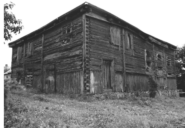
Synagogue in Alanta (2004)/Synagoge in Alanta (2004).

Bei Holzsynagogen denkt man vor allem an die Publikation des Ehepaars Piechotka, dessen Fotos von der Pracht und dem Reichtum der längst zerstörten Gotteshäuser zeugen. Nur wenige wissen hingegen, daß in Litauen noch eine ganze Reihe dieser besonderen Bauwerke erhalten ist.