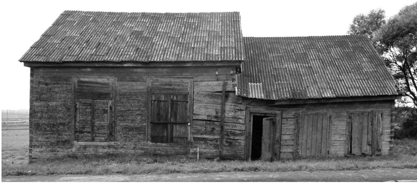
l: Synagogue and rabbi's house in Kaltinenai (2004)/Synagoge und Rabbinerhaus in Kaltinenai (2004).