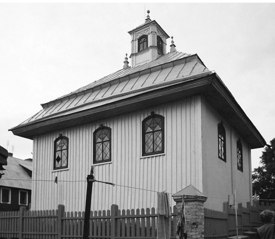
Karaite kenassa, Trakai, view from the backyard (2004)/Karaite kenassa, Trakai, Ansicht vom Hinterhof (2004).

Es erscheint wie ein Wunder, daß ausgerechnet Synagogen aus Holz den Holocaust und die nachfolgenden Jahre bis heute überstanden haben. Paradoxerweise sind jene Bauten am besten erhalten, die als private Getreidelager dienten, während die öffentlich genutzten in ruinösem Zustand sind. Noch immer sind die Holzsynagogen gefährdet, aber die Gefahr abgebaut und als Brennholz verkauft zu werden – wie es in Rozalimas beinahe geschehen wäre – ist aufgrund des größeren öffentlichen Interesses am jüdischen Erbe in Litauen heute wohl nicht mehr gegeben.